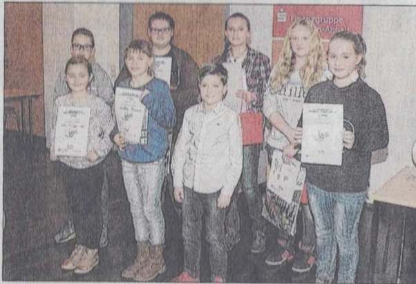
Die glücklichen Gewinner des Vorlesewettbewerbs posieren mit ihren Urkunden.

Jedem der 20 Teilnehmer war der Spaß am Platt anzu-